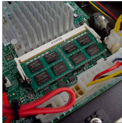
Enorm viel RAM wurde dem Server mitgegeben, um Musik direkt aus dem Speicher abspielen zu können