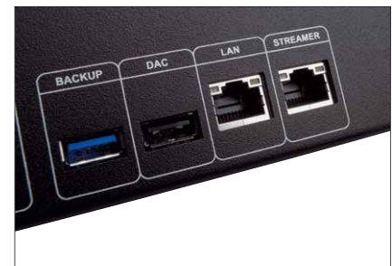
Ein zusätzlicher Ethernet-Port erlaubt den direkten Anschluss von Streamern an den Server, wobei ein zusätzlicher Filter angewandt wird

Servers sitzt nun ein neuer Vierkern-Prozessor von Intel, und auch am zugehörigen Arbeitsspeicher hat man etwas getan. Insgesamt satte acht Gigabyte RAM bietet der Zen nun, wobei dieser geteilt ist zwischen Arbeitsvorgängen und Audiobuffer. Während vier GB für Prozesse bezüglich der Bedienung und der Wiedergabe genutzt werden,