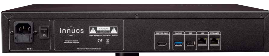
Klares Design und durchdachte Anschlussauswahl waren schon bei den Mk-II-Versionen von Innuos ein Markenzeichen