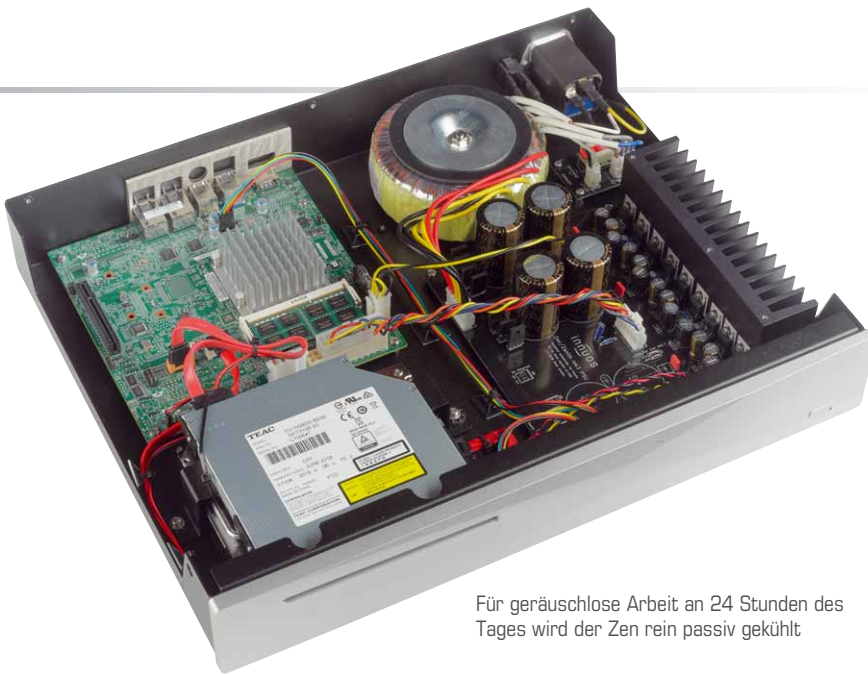
Für geräuschlose Arbeit an 24 Stunden des Tages wird der Zen rein passiv gekühlt

Datenfreigabe. Sonos-Systeme können die gespeicherte Musik ebenfalls beziehen und auch die Implementierung von Roon ist möglich. Dabei kann man den Zen sogar als eigenen Roon-Core einrichten, sodass er als Zentrale für andere Roon-fähige Geräte eingesetzt werden kann. Alternativ schaltet man lediglich die Renderer-Funktion frei, sodass man den Zen zusammen mit seinen anderen Geräten steuern kann. Auch Qobuz, Tidal und Spotify können mit den passenden Anmeldedaten eingerichtet werden, während der direkte Einsatz des Servers mithilfe von Squeezebox-fähigen Apps erfolgen kann.