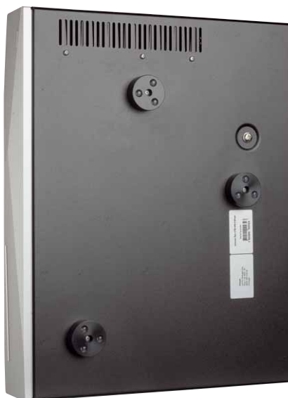
Mit den neuen Gerätefüßen werden Vibrationen gut vermieden, auch wenn der Server dadurch nun etwas weniger stabil steht