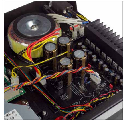
Das neue Netzteil ist sehr viel größer, liefert klar besseren Sound und vermeidet Beeinflussungen

wird in der zweiten Hälfte die gespielte Musik vorgeladen und anschließend aus dem Festspeicher abgespielt. Die interne Festplatte des Servers dient also einzig zur Aufbewahrung der Musik, sodass beim Abspielen möglichst wenig Interferenzen auftreten können.