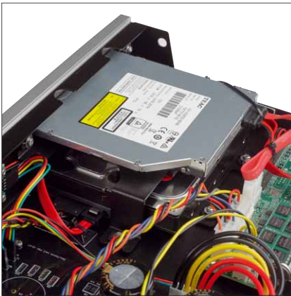
Die Festplatte unter dem CD-Laufwerk kann jetzt mit bis zu 8 TB Speicherplatz geordert werden